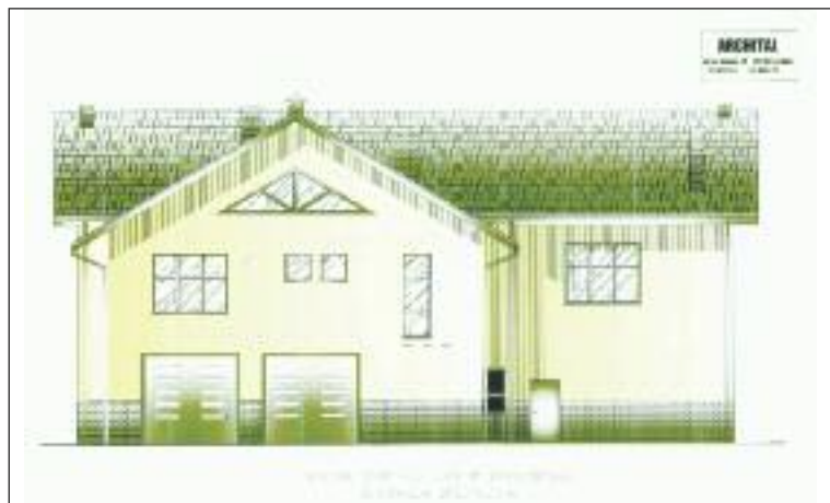
Fot. Wizualizacja Domu Kultury w Targowisku po modernizacji.

Ziobro, na razie skupia się na teraźniejszości. – Najważniejsze to być dobrym posłem. Mam nadzieję, że po czteroletniej kadencji ludzie, którzy na mnie głosowali będą zadowoleni z mojej pracy – zaznacza 22-letni parlamentarzysta. dg