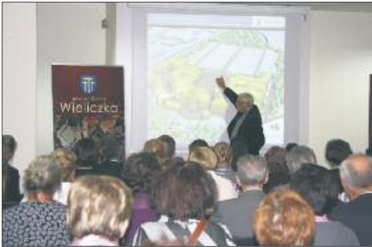
Inauguracyjny wykład dla studentów Trzeciego Wieku.

28 października około 100 osób wzięło udział w uroczystej inauguracji działalności Uniwersytetu Trzeciego Wieku im. Jana Pawła II w Krakowie. Powstanie tego uniwersytetu to wspólna inicjatywa gminy Wieliczka oraz Centrum Jana Pawła II „Nie lękajcie się!” w Krakowie. Opiekę merytoryczną nad instytucją sprawują profesorowie Uniwersytetu Papieskiego Jana Pawła II w Krakowie. Przedsięwzięciu patronuje ks. kard. Stanisław Dziwisz. Zajęcia odbywają się co dwa tygodnie, raz w Wieliczce (Centrum Edukacyjno – Rekreacyjne „Solne Miasto”) i raz w Krakowie (Centrum Jana Pawła II „Nie lękajcie się!”, ul. Kanonicza 18).